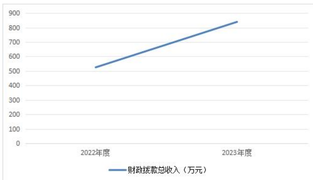
图 4：财政拨款收、支决算总计变动情况

动经费增加。政府性基金预算财政拨款收入 0.00 万元，比 2022 年度决算数持平,主要原因是本单位近两年无此科目收入。国有资本经营预算财政拨款收入 0.00 万元，比 2022 年度决算数持平,主要原因是本单位年两年无此科目收入。