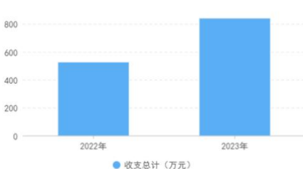
图 1：收、支决算总计变动情况

2023 年度收、支总计均为 839.07 万元。与 2022 年度相比，收、支总计增加 314.39 万元，增长 59.9%，主要原因是：1、今年通过招考新进人员 3 人，以及政策性增资导致人员支出增加；2、演出活动增加导致演出活动经费增加。